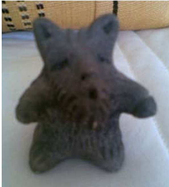
Abb. 1 Figur A (Franke 2011, S. 98)

geantwortet werden, das die ressourcenorientierte Utilisierung des Substanzkonsums in einer späteren Therapiephase zeigt.