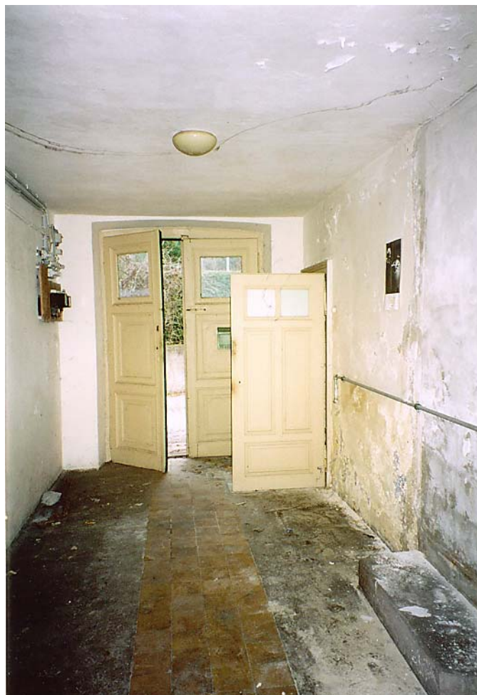
Eingang-Ausgang, Vorraum Dez. 04, Aufnahme: Frau Barbara Pfaffenwimmer

So werden wir beim Eingang informiert. Dez. 04, Aufnahme: Frau Barbara Pfaffenwimmer