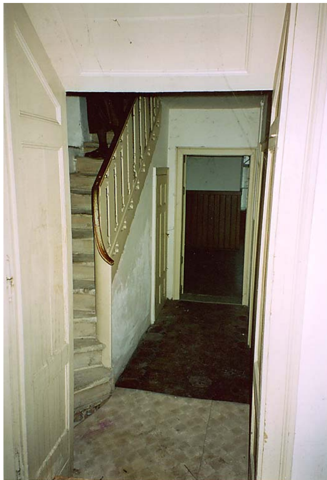
Aufgang zum ersten Stock Dez. 04