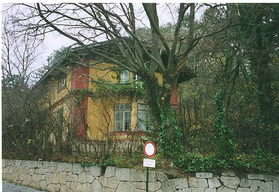
Abschied Blick zurück „Wir kommen wieder“ Liebes Haus „Maital 4“ Du musst noch erhalten und renoviert werden. Dez. 04, Aufnahme: Frau Barbara Pfaffenwimmer