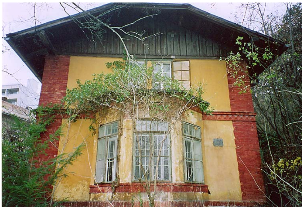
„Maital 4“ Morenos Haus Vordere Seitenansicht

Dez. 04